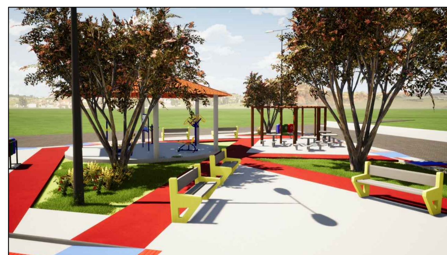
Praça Pública Maquete Eletrônica