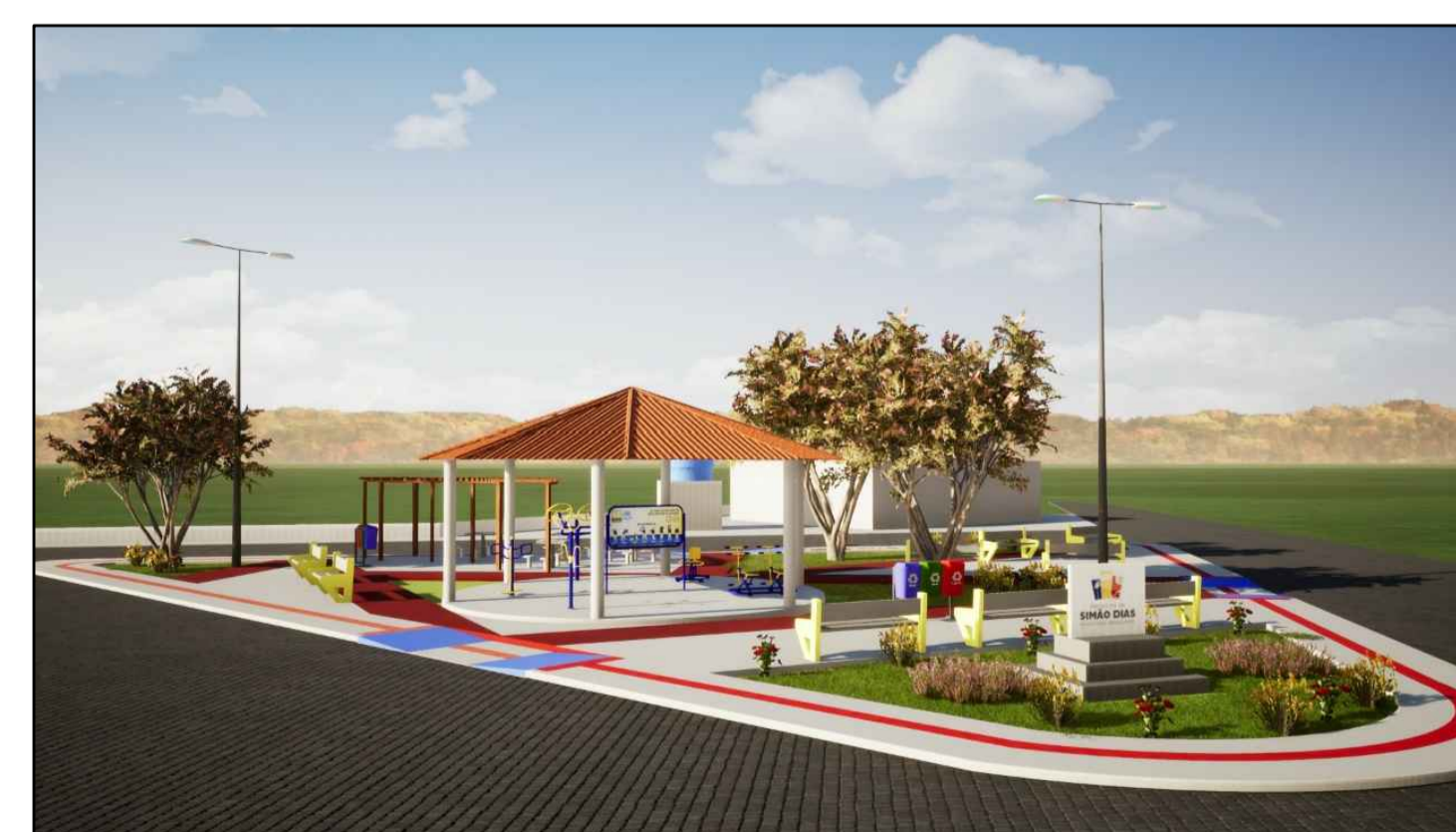
Praça Pública Maquete Eletrônica