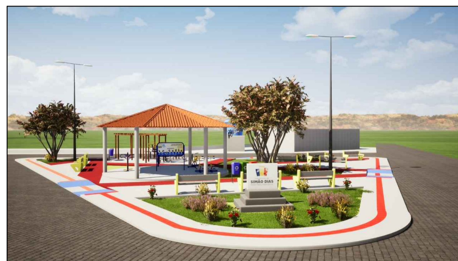
Praça Pública Maquete Eletrônica